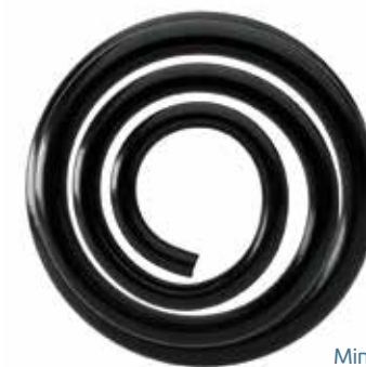
Miniblock-Feder aus super-progressivem, inkonstantem Draht (Draufsicht)